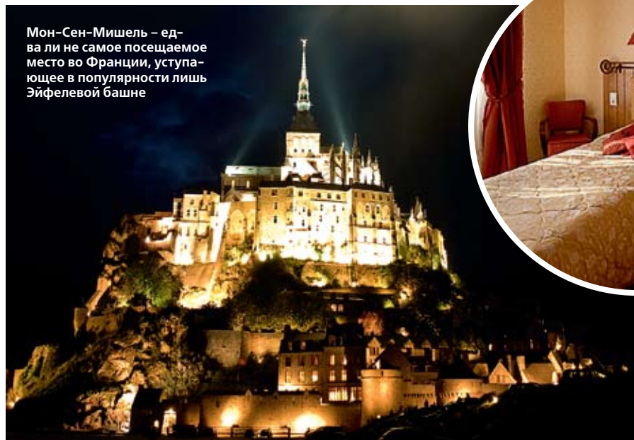
Мон-Сен-Мишель – едва ли не самое посещаемое место во Франции, уступающее в популярности лишь Эйфелевой башне