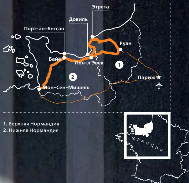
1. Верхняя Нормандия 2. Нижняя Нормандия