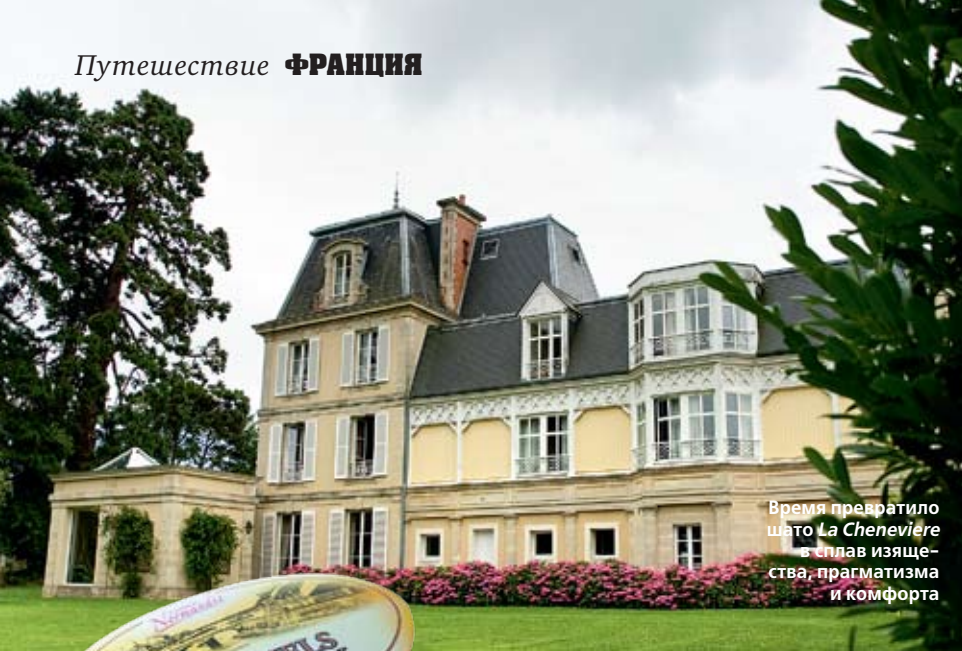
Время превратило шато La Cheneviere в плап изящества, прагматизма и комфорта